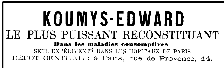
Fig. 4 : Encart publicitaire pour le "koumys Edward" paru en 1874 dans Le Progrès Médical , du n°35 (29 août) au n°52 (26 décembre)

Dieu (service de M. Guéneau de Mussy), à Beaujon (service de M. Gubler) ainsi qu'à Necker (service de M. Chauffard). Par ailleurs, une campagne publicitaire pour le koumys Edward paraît dans la presse médicale ( Figure 4 ).