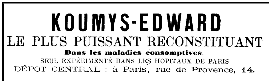
Fig. 4 : Encart publicitaire pour le "koumys Edward" paru en 1874 dans Le Progrès Médical , du n°35 (29 août) au n°52 (26 décembre)